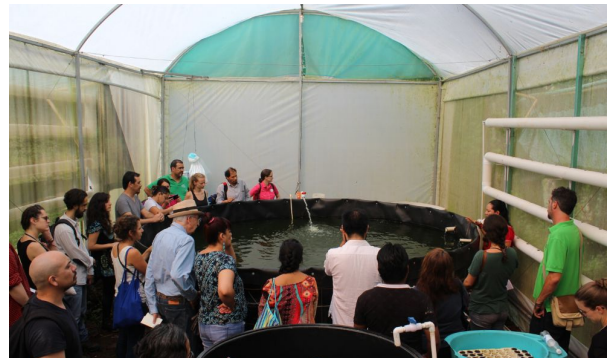
Piscicultura en el centro educativo de la Tosepan.

En su centro de educación primaria, las futuras generaciones de cooperativistas aprenden a cuidar los recursos naturales, en este caso, las niñas explican cómo manejan su meliponario (apiario de abejas meliponas) para producir miel.