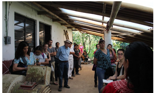
Ingeniera explica cómo se utilizan los bioles para generar abonos orgánicos a gran escala.