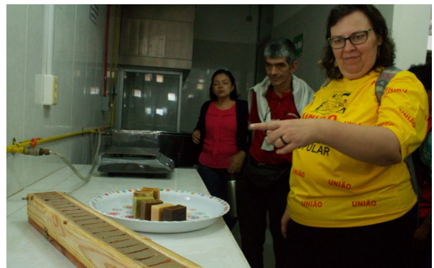
Evaniza (UNMP) descubre los productos cosméticos y jabones elaborados con miel de abeja melipona.