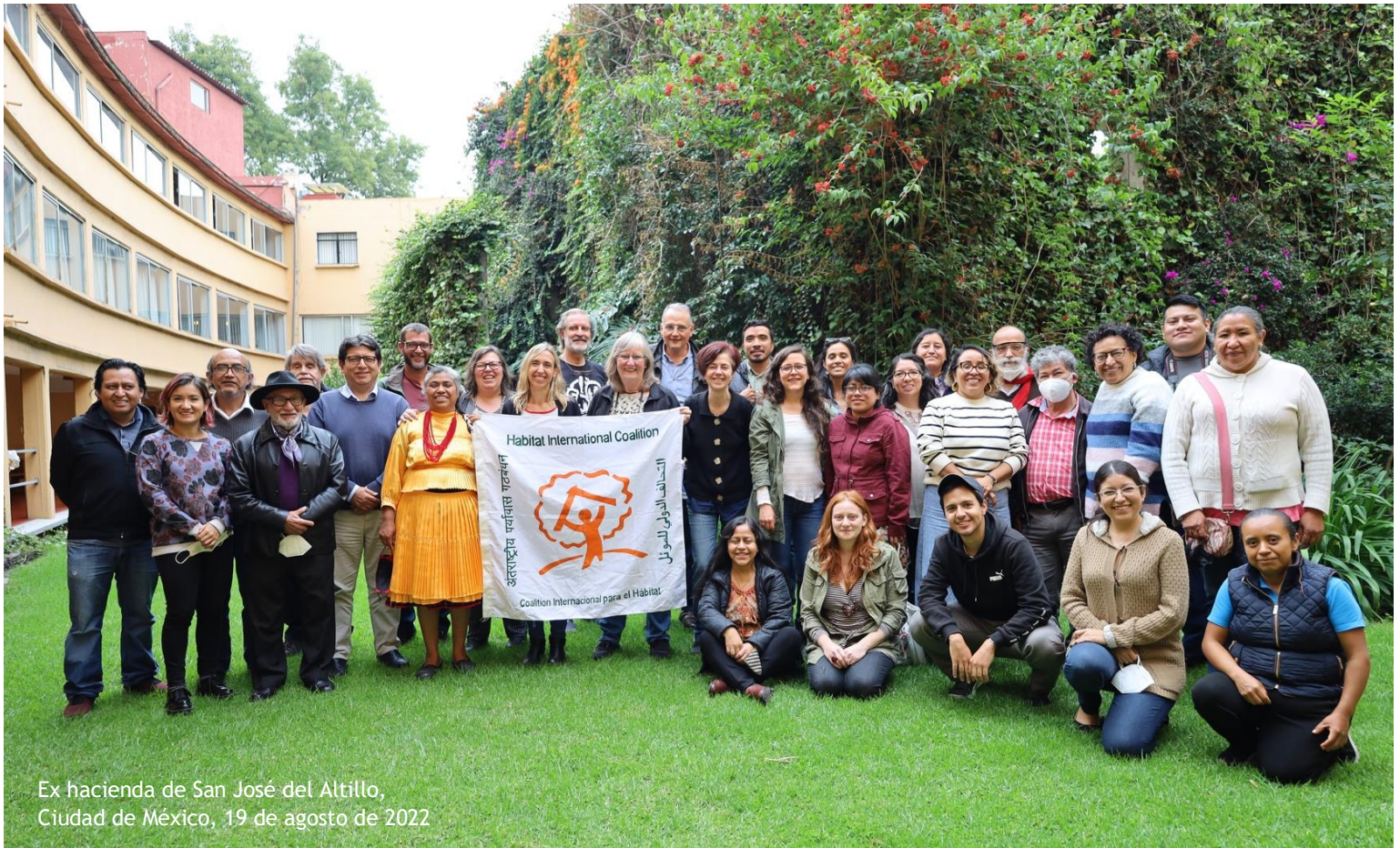
Ex hacienda de San José del Altillo, Ciudad de México, 19 de agosto de 2022